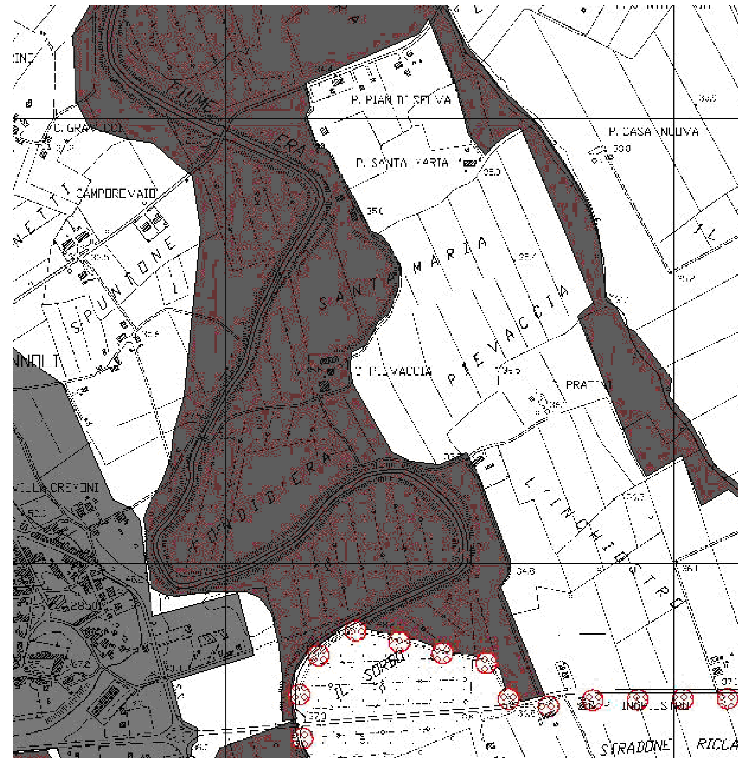
Estratto Tav. AG03 - aree tartufigene del PIANO STRUTTURALE COMUNALE